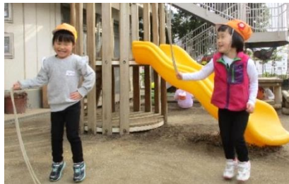
なわとびがんばる！

トイレや手洗い・着替え・食後のうがいなど、身の回りの事を自らしようとする姿が見られます。繰り返し行ってきたことが習慣付いてきたようです。片付けの時には、一生懸命最後まで片付けようとしています。「次にばなな組になるから！」と足置きの片付けや椅子の準備なども手伝ってくれていますよ。