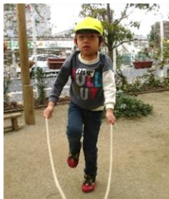
けんけん跳びに挑戦！

リーダー活動やドッジボールをするぶどう組の姿を見て、「もうすぐリーダーしないと！」「はやくぶどう組になりたい」と日々刺激を受けて、進級に期待感が高まってきているようです。朝の継続運動の縄跳びでは「後ろ跳び や けんけん跳び」など、難しい跳び方にも積極的にチャレンジしていますよ。