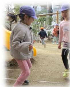
ゴム跳びにも挑戦