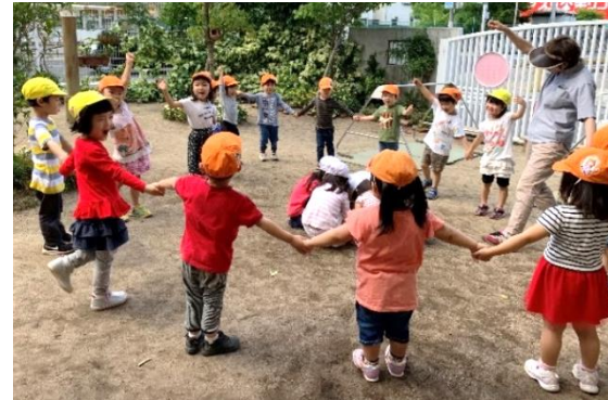
ばなな組と一緒に むっくりくまさん