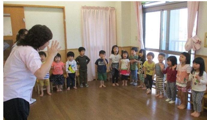
楽しいリズムの時間♪

朝の継続運動として、毎日マラソンとなわとびを頑張っている ばなな組。継続して練習し、成果を実感することで「次も、もっと頑張ろう、という前向きな気持ちが子どもの表情から伺えます。うんどう遊びでしている鉄棒にも「前まわり出来るようになる!」「逆上がり頑張る!」と意欲的に取り組んでいます。