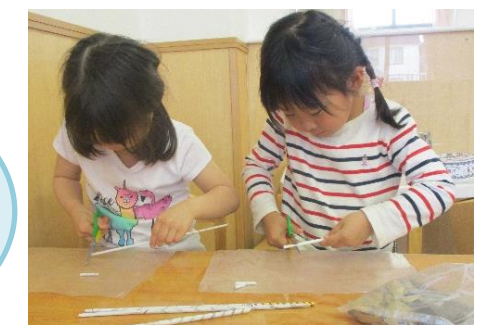
はさみでチョキチョキ