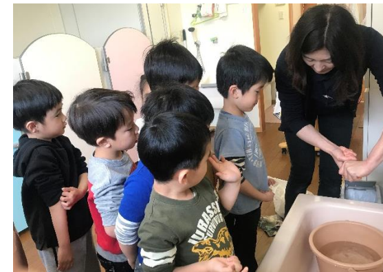
リトミック前は雑巾がけ