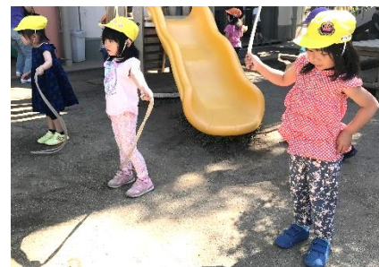
毎日なわとびの練習に取り組んでいます