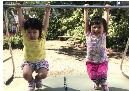
ぶらさがり 10秒がんばるよ!

朝の継続運動として、毎日マラソンとなわとびを頑張っている ばなな組。継続して練習し、成果を実感することで「次も、もっと頑張ろう、という前向きな気持ちが子どもの表情から伺えます。うんどう遊びでしている鉄棒にも「前まわり出来るようになる!」「逆上がり頑張る!」と意欲的に取り組んでいます。