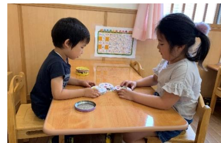
ぶどう組とドフリ! 負けなし!!