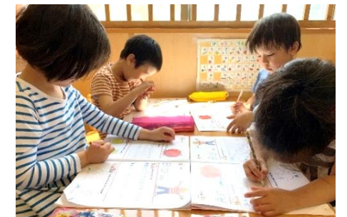
5月から英語のワークが始まりました