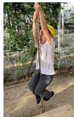
のぼり棒にも挑戦