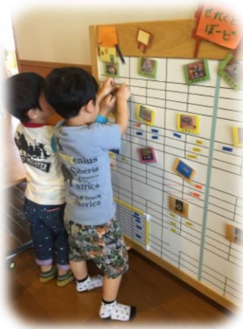
どの玩具で遊ぼうかなー♪

コーナーの玩具や遊びのルールなど約束事があることを知ったみかん組。新しい玩具に目を輝かせ、始めは“何処で遊ぼうかな～”と考えながらコーナー遊びを経験してきました。自分の好きな遊びを見つけ、少し集中して遊ぶ姿が見られ、楽しく過ごす表情も見られます。