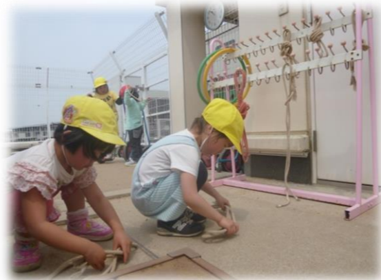
使った後は、かたづけます！！