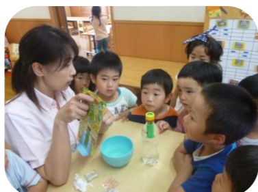
えだまめ、すくすく育つかな..?