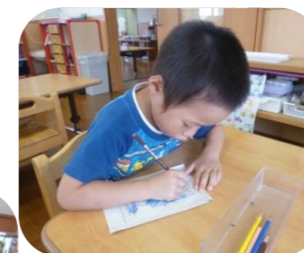
次は、何色で塗ろうかなあ...

月初めに、「今月のぬいえ」として、4枚一組セットで子ども達一人ひとりにぬいえを手渡しています。自分の物という意識もさらに深まり、大事にしています。ときどき覗いてみて下さいね!