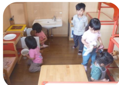
片付け よーいドン!