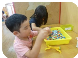
かまきりのあかちゃん、いっぱい作ったよ!