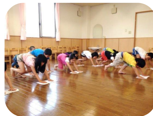
みんなの部屋をピカピカに。足腰も鍛えられます。

毎日のリーダー活動は、朝の挨拶、給食の用意の手伝い、みかん組の給食運び、掃除、トマトの水やりなど生活の様々な場面で活躍しています。迷った時は、ペアのリーダー同士で話し合い、自分達で考えを出して行動しています。リーダーの活動だけではなく、年長児としての見本を見せてくれています。