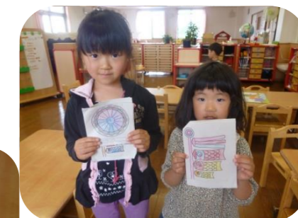
きれいに塗れたでしょ?