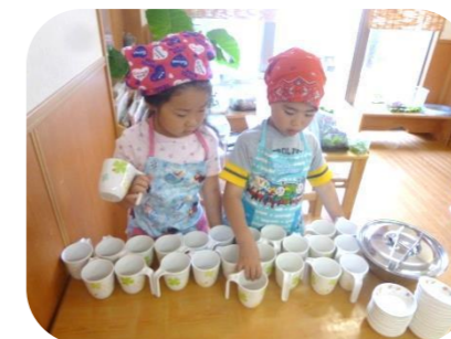
リーダー活動。人数分のコップを並べます。