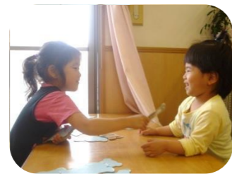
お姉ちゃんと一緒にゲーム☆