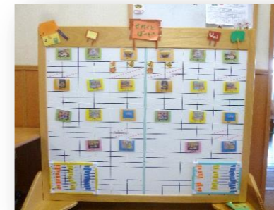
「セレクトボード」 各コーナーの人数制限を設けるのは、子どもが集中して遊べる環境を保障するためです。