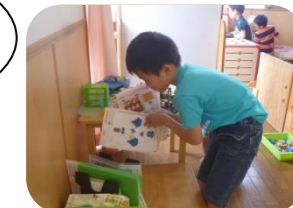
使い終わったら、きれいに整頓。年下の友達の見本です。