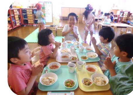
そろった事を確認し、手を合わせて「いただきます」