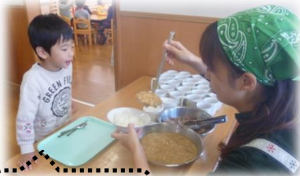
給食の配膳の様子

子どもたちは、自ら給食の配膳を行う事が慣れてきて、メニューを見ては、「おおもり!」「ちょっと少なめ…」と自分が食べれる量を意識する姿が見られ始めました。自ら配膳する事が、子どもたちにとって、給食の楽しみの時間になっているように感じます。